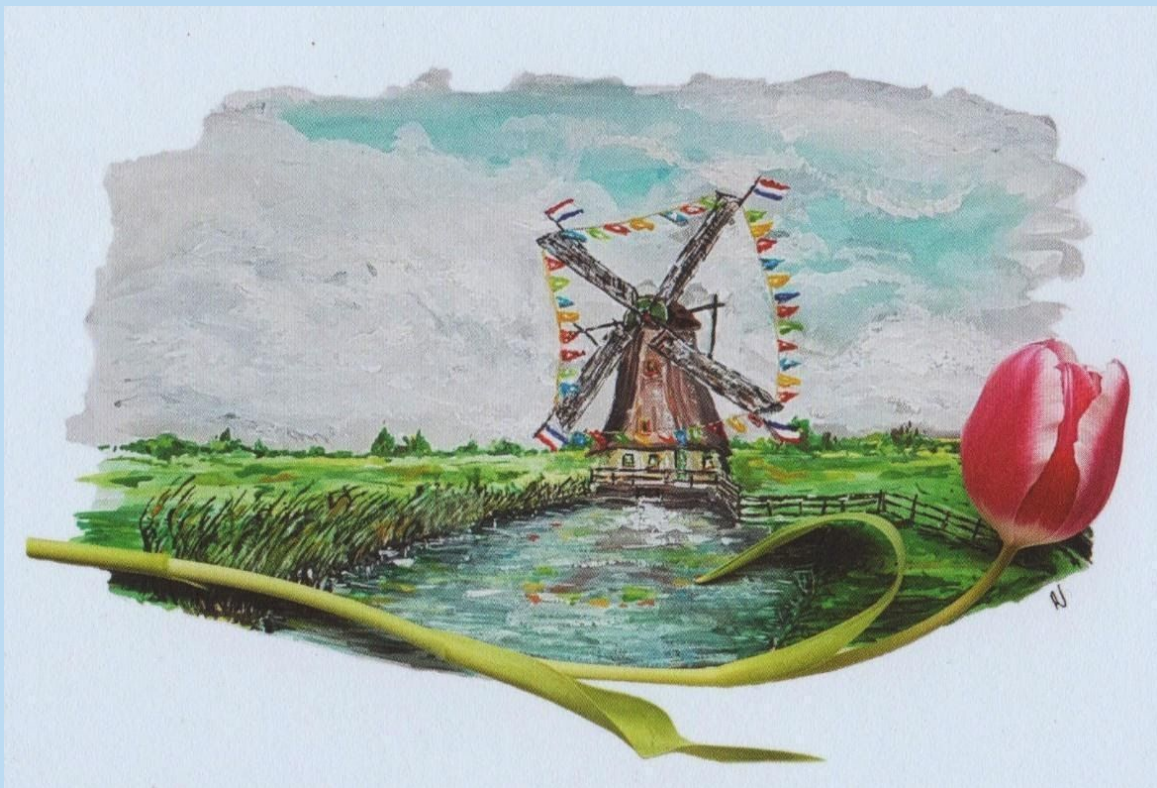
Afb. 2. Op 26 maart ontvingen we van Studio Klaproos deze kaarten om bij onze vaste bezoekers en vrijwilligers te bezorgen. Dit was bedoeld om ze in deze moeilijke en voor velen eenzame tijd een teken van medeleven aan te reiken. Dat leverde vele positieve reacties op.