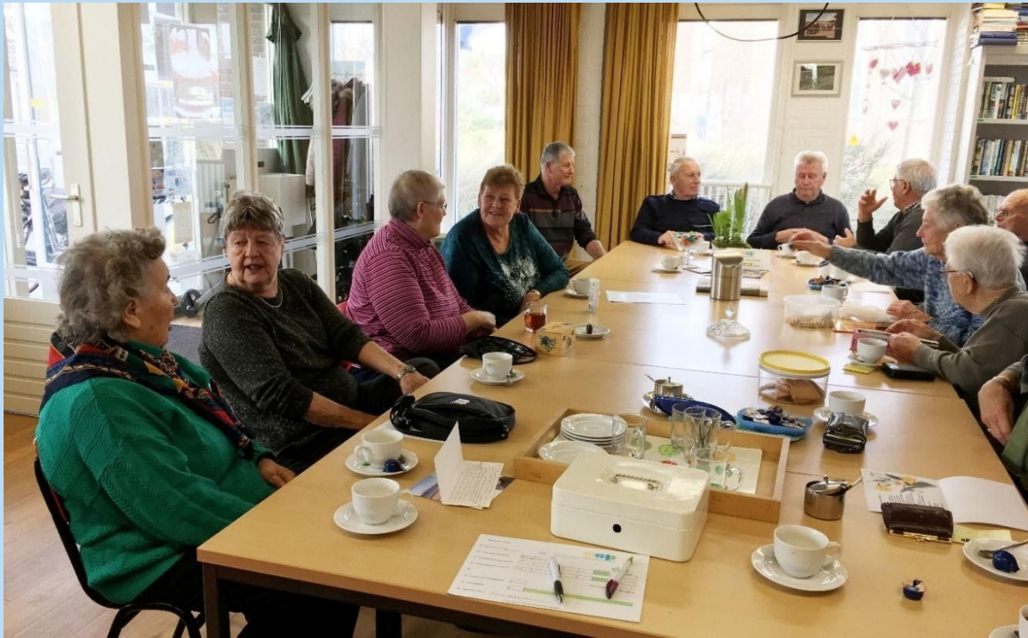
Afb. 1. Bijeenkomst 17 februari in het DOP-gebouw. We maakten ons al klaar om dit seizoen weer diverse speciale bijeenkomsten te organiseren.