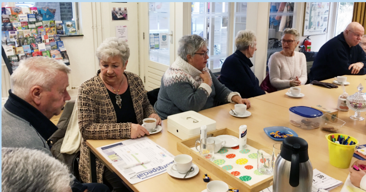
Afb. 3. Bijeenkomst DOP Petten 1 februari 2020, zoals vaak vol bezet. We hadden toen nog geen idee dat we de volgende maand hier niet meer terug konden komen.

Daardoor kon dus ook de traditionele brunch die we elke zomer organiseren en die bekostigd wordt uit de inkomsten van de verkoop van boeken niet doorgaan.