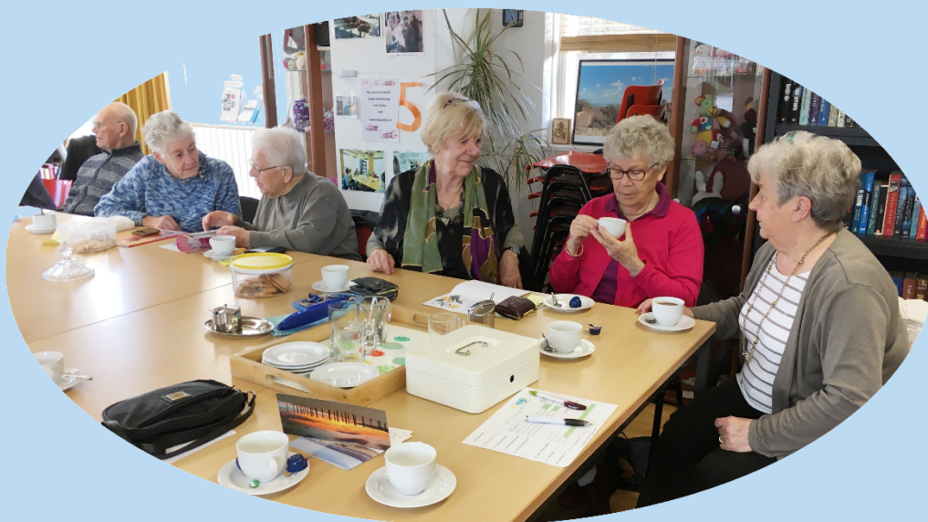
Afb.15. Ondanks dat onze bezoekers erg blij waren dat we in de kerk onze bijeenkomsten konden vervolgen, ziet iedereen er met smart naar uit dat we weer zoals hier met normale onderlinge afstanden bijeen mogen komen.