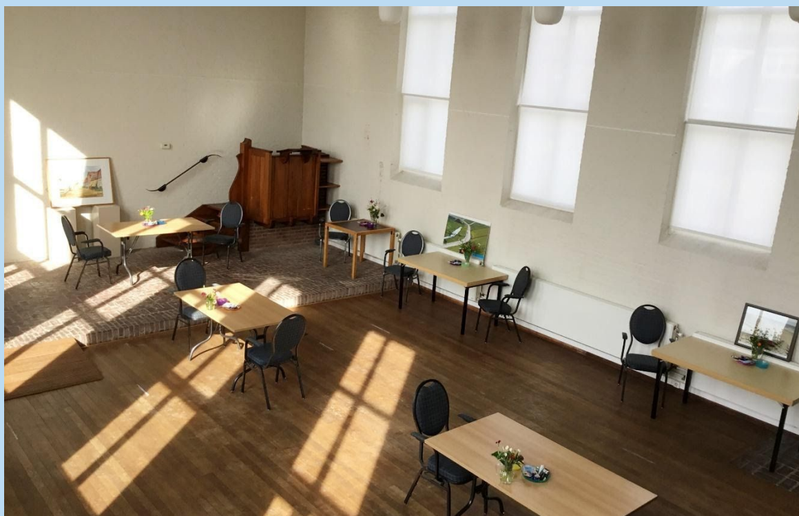
Afb. 4. Dankzij medewerking van de gemeente konden we vanaf 3 juni de leegstaande kerk gebruiken. Daarom werd het mogelijk de bijeenkomsten van het DOP van 3 maal per week te vervolgen.