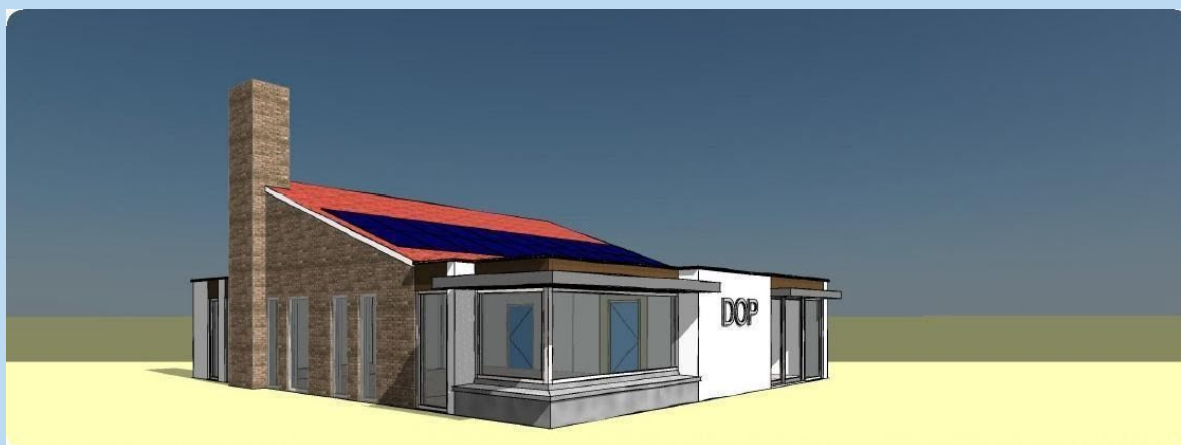
Afb. 9. Perspectief geplande uitbouw van het DOP-gebouw.