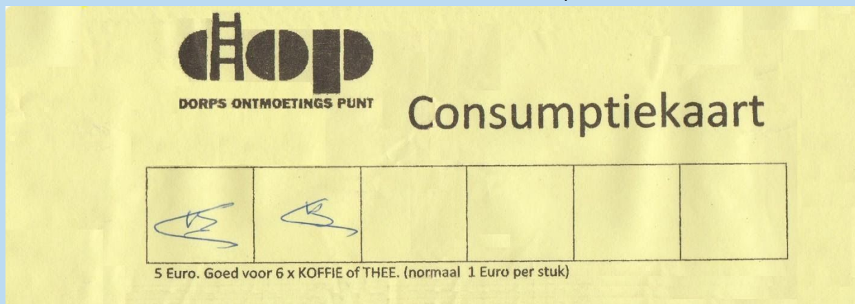
Afb. 14. Consumptiekaart DOP, goed voor zes consumpties.

De toename van het aantal bezoekers beïnvloedt het kassaldo positief.