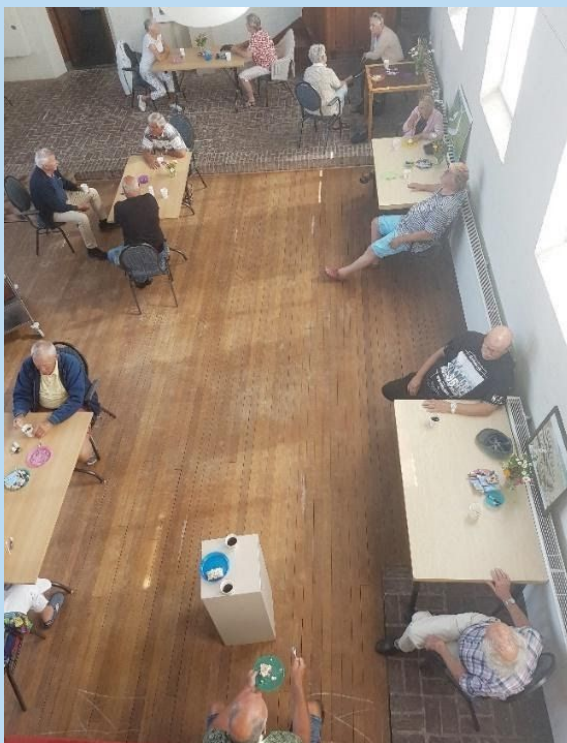
Afb.7. In de ruime kerk konden we de onderlinge afstand van 1½ m aanhouden en goed ventileren. We gebruikten weggoobekers en veel ontsmettingsmiddelen. Hierdoor konden we het hele jaar veilig 3x per week bijeenkomen.

Meer informatie over de VOA is op de homepage van onze site te vinden.