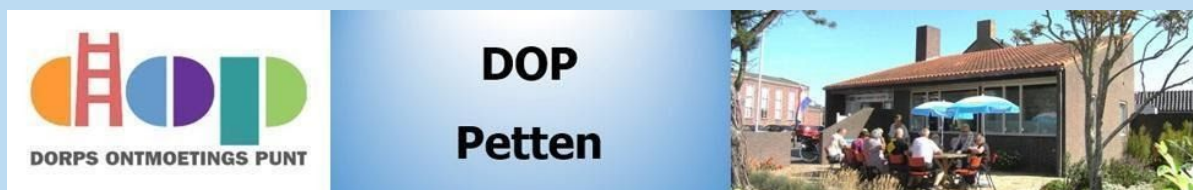
Afb. 5. Bovenbalk website www.doppetten.nl .

Vanaf augustus 2015 is onze website www.doppetten.nl actief.