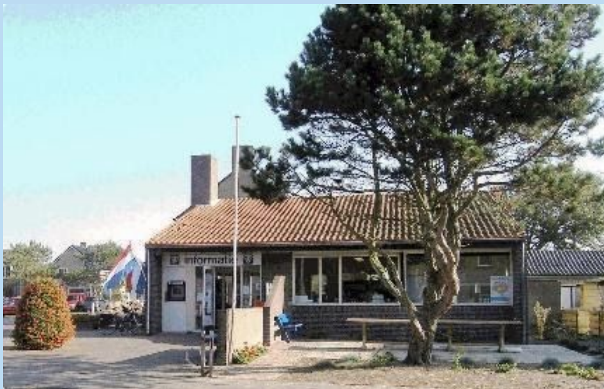
Afb. 8. Huidig DOP-gebouw wordt gezien het toenemend bezoek te klein.

Op 16 januari 2020 is dit besluit in een overleg tussen beide besturen in aanwezigheid van de architect nogmaals bekrachtigd. Daarbij heeft Piet Breed als bestuurslid SEBAP nog een voorstel ingebracht voor een kleinere interne verbouw. Dit werd door het DOP-bestuur direct als niet bruikbaar afgewezen. Bij navraag bij de overige aanwezige SEBAP-bestuursleden hebben die daarbij aangegeven, dat zij zoals afgesproken de afspraak respecteren om constructief mee te werken aan het afronden van het door DOP opgestelde uitbreidingsplan.